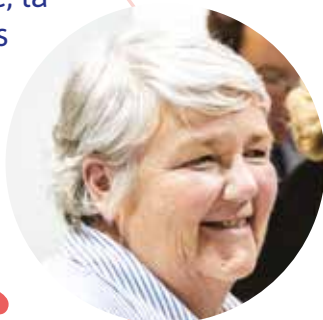
Jacqueline Gourault ministre de la Cohésion des territoires et des Relations avec les collectivités territoriales

“ J'ai souhaité que la mission formule des propositions pour améliorer la vie quotidienne des habitants des territoires ruraux dans des domaines tels que l'accès aux services essentiels, la revitalisation des territoires, la transition écologique, l'agriculture, la santé, l'emploi, les mobilités mais aussi sur des thématiques plus rarement appréhendées par les politiques publiques comme le renouvellement des générations, le vieillissement et l'isolement, la culture ou encore l'économie sociale et solidaire. ”